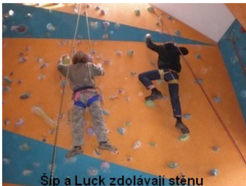
Šíp a Luck zdolávají stěnu